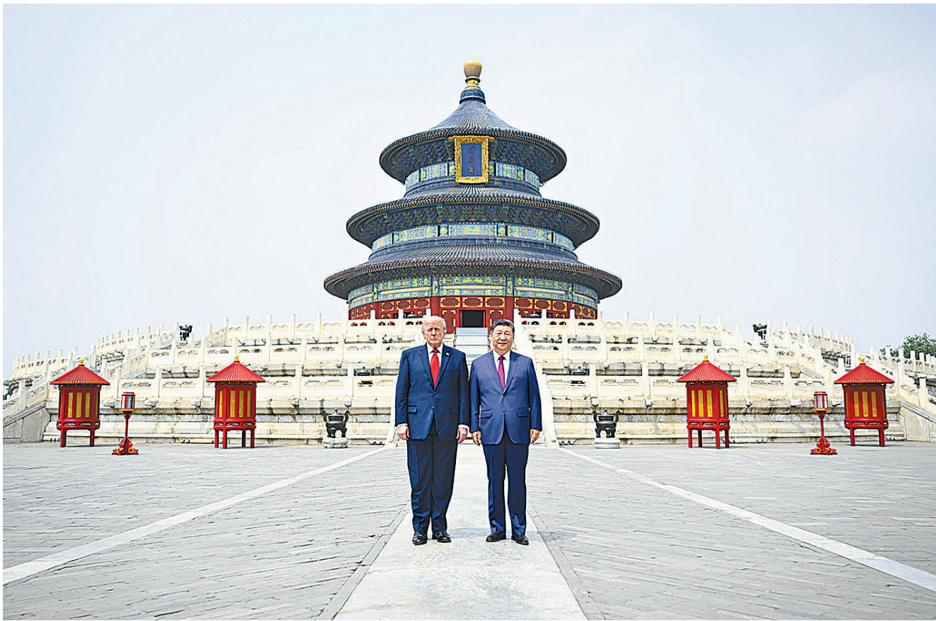
5月14日，国家主席习近平同来华进行国事访问的美国总统特朗普参观天坛。两国元首在祈年殿广场合影。