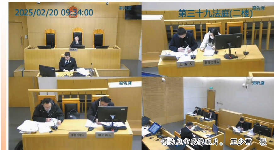
图为庭审录像照片。

法律的温情，应当体现在对公平正义的执着追求和对社会长远利益的守护上，而不应体现在对个体“谁弱谁有理”“谁受伤谁有理”的片面迁就上。这份判决书告诫每一位公民：真正的“有理”，是对自己生命的珍视，是对家人期待的负责，是对社会规则的遵守。对自己行为负责，是现代公民的基本素养，也是对生命最大的尊重。