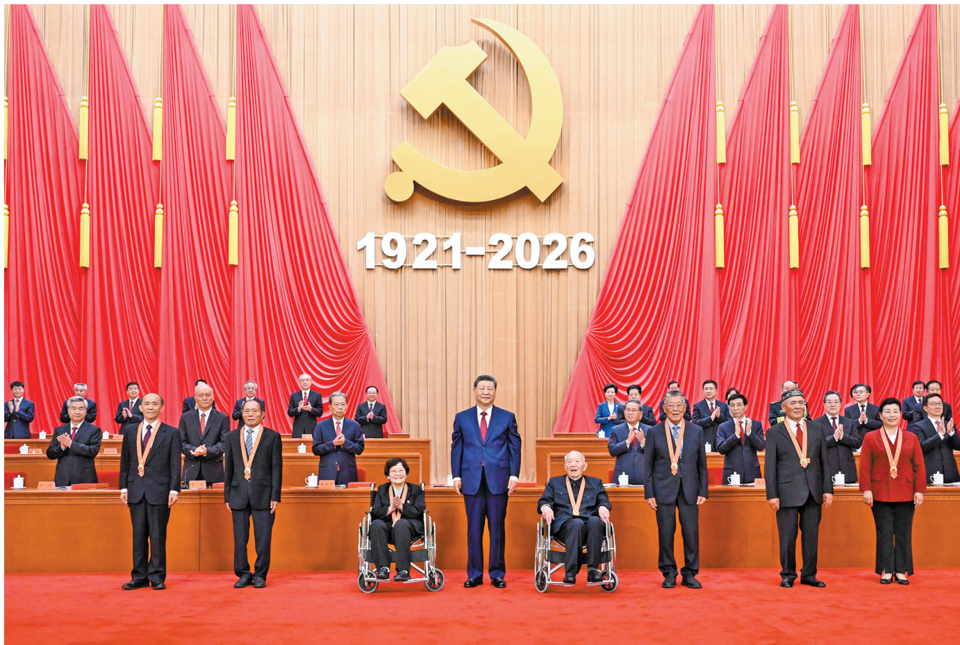
7月1日上午，庆祝中国共产党成立105周年大会在北京人民大会堂隆重举行。中共中央总书记、国家主席、中央军委主席习近平向“七一勋章”获得者颁授勋章。

新华社北京7月1日电 庆祝中国共产党成立105周年大会7月1日上午在北京人民大会堂隆重举行。中共中央总书记、国家主席、中央军委主席习近平向“七一勋章”获得者颁授勋章并发表重要讲话。他强调，105年来，我们党始终坚守为中国人民谋幸福、为中华民族谋复兴的初心使命，在不懈奋斗中创造了彪炳史册的伟大成就。新征程上，全党同志要坚定信心、接续奋斗，不断创造无愧于时代和人民的新业绩。