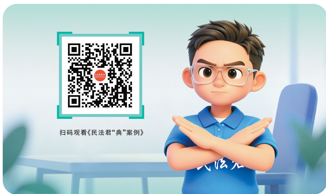
扫码观看《民法君“典”案例》