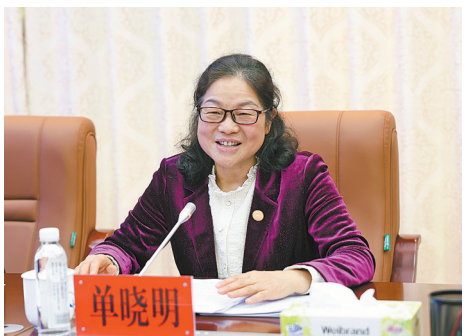
图为全国人大代表单晓明参加座谈并发言。

单晓明建议，优化司法资源配置，实现司法资源科学统筹，推动司法体制改革成果更好惠及一线、服务群众。