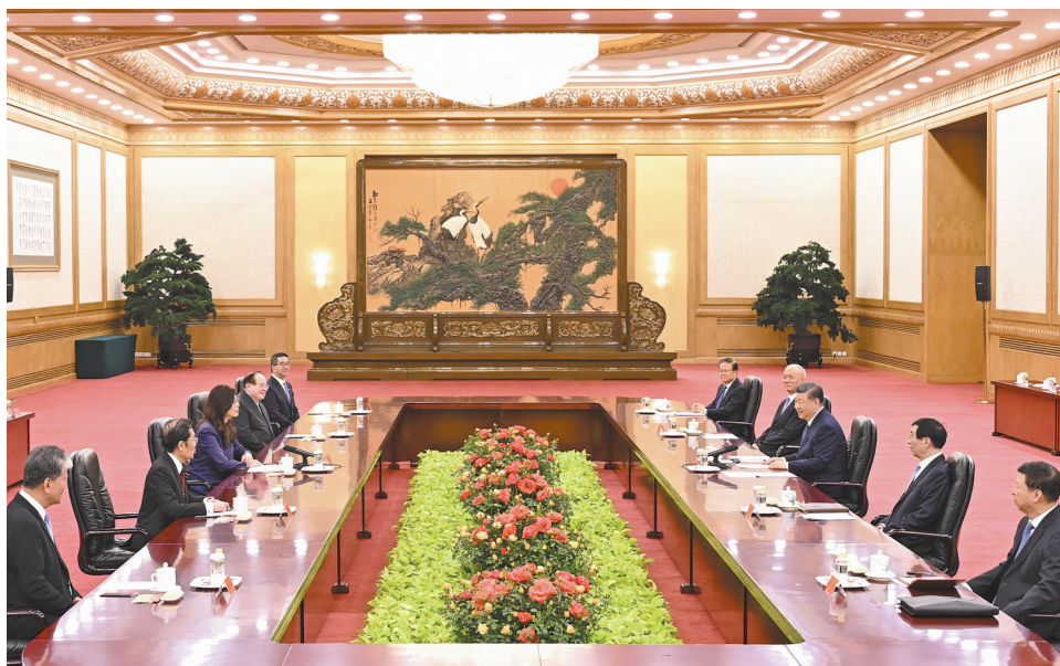
4月10日上午，中共中央总书记习近平在北京会见郑丽文主席率领的中国国民党访问团。