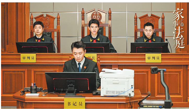
电视剧《家事法庭》剧照。