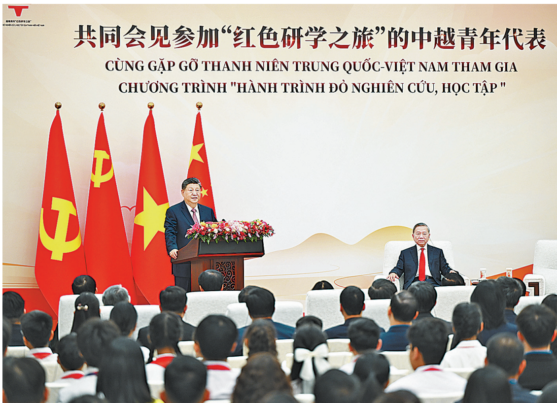
共同会见参加“红色研学之旅”的中越青年代表 CÙNG GẶP GỠ THANH NIÊN TRUNG QUỐC-VIỆT NAM THAM GIA CHƯƠNG TRÌNH "HÀNH TRÌNH ĐỎ NGHIÊN CỨU, HỌC TẬP"

四月十五日上午，中共中央总书记、国家主席习近平在人民大会堂同来华进行国事访问的越共中央总书记、国家主席苏林共同会见参加“红色研学之旅”的中越青年代表。