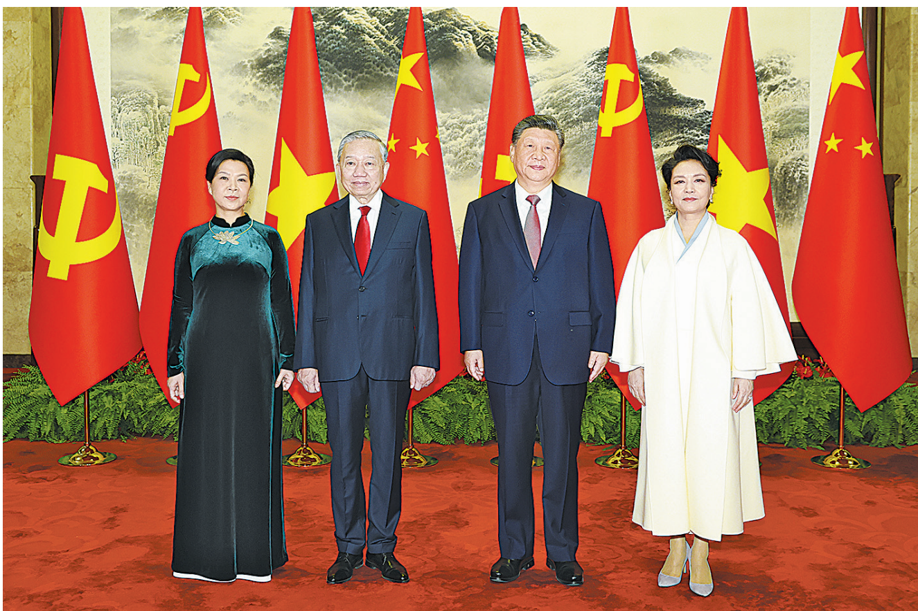
4月15日上午，中共中央总书记、国家主席习近平在北京人民大会堂同来华进行国事访问的越共中央总书记、国家主席苏林举行会谈。这是会谈前，习近平和夫人彭丽媛同苏林和夫人吴芳瑞合影。