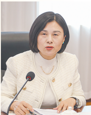
图为全国人大代表韩秋香。

依海而兴的营口鲅鱼圈,处处焕发着生机与活力。今年以来,辽宁省营口市鲅鱼圈区人民法院经历了一场脱薄蜕变。