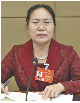
图为全国人大代表于安玲。

“今年以来，金乡法院针对短板弱项精准发力，在政治建设、审判质效等方面取得扎实进展，展现出‘脱薄向强’过程中的坚定决心与显著成效。”近日，全国人大代表、济宁市农业科学研究院