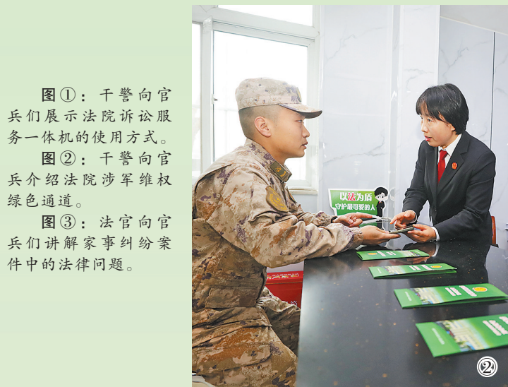
图①：干警向官兵们展示法院诉讼服务一体机的使用方式。 图②：干警向官兵介绍法院涉军维权绿色通道。 图③：法官向官兵讲解家事纠纷案件中的法律问题。

随后,官兵们来到审判庭,旁听了一起家事纠纷案件的庭审。从法庭调查、举证质证到法庭辩论,官兵们全程观摩,直观感受司法程序的严谨规范。庭审结束后,承办法官现场释法,解析案件裁判思路,帮助官兵们深化对法律适用的理解,并向官兵们送上了法治书签。