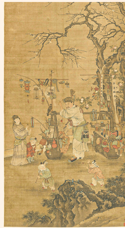
明人绢本设色《货郎图》

计盛《货郎图》中的货郎形象,便是这一制度在艺术中的生动投射。画面中的货担琳琅满目,所售之物非寻常乡野粗货,而是精致考究的宫廷工艺品与玩物,货郎本人的衣着神态也褪去了乡野气息,显得儒雅从容。他们或因长期供应宫廷所需,或因与官府有业务往来,从而在身份上获得了某种“准官方”色彩,其形象也随之被赋予更多的文雅与尊贵。