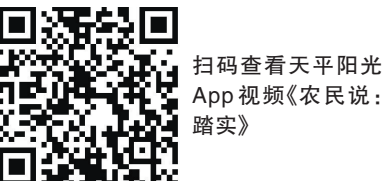
扫码查看天平阳光App视频《农民说：踏实》

人民法院立足审判职能，积极配合农业农村等部门开展“规范网络销售农资”“打击‘农资忽悠团’”等专项整治行动，强化刑刑衔接，提升打击合力。各地法院通过组织旁听庭审、公开宣判、普法宣传等形式，积极开展法治宣传教育，引导农资生产经营增强责任意识、规范生产经营行为，帮助广大消费者提高识别防范能力、更好维护自身权益，为农业丰收、农民增收和乡村振兴提供了有力司法保障。