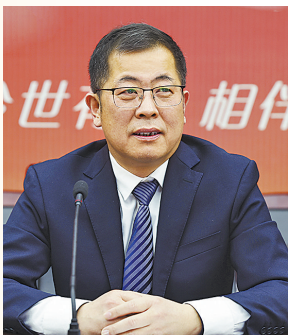
全国人大代表顾祥悦。

“加强全国相对薄弱基层法院建设是人民法院抓基层、打基础、固根本，奋力推进审判工作现代化的重要部署。涟水法院自开展脱薄工作以来，坚持补短板、强弱项，抓前端、治未病，审判质效稳步提升，法护营