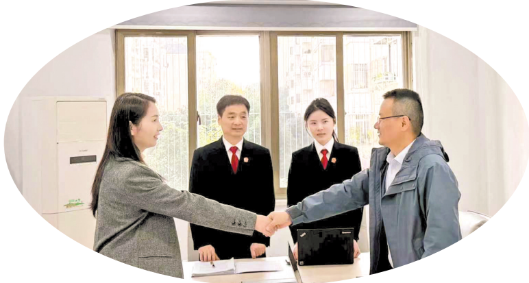
▲肥西法院法官成功调解一起买卖合同纠纷,当事人握手言和。

新能源汽车生产线昼夜轰鸣、高端制造集群拔节生长、生物医药产业蓬勃发展……作为安徽省县域经济发展的“排头兵”,安徽省肥西县正以强劲的产业动能谱写高质量发展新篇章。在这片活力迸发的热土上,肥县人民法院主动融入发展大局,充分发挥司法职能,以精准高效的司法服务为营商环境注入法治“活水”,为县域经济社会高质量发展保驾护航。