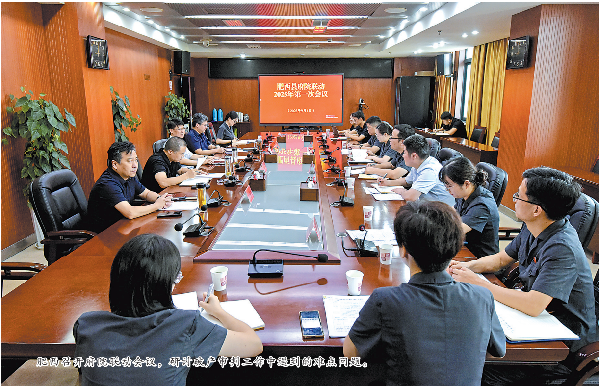
肥西召开府院联动会议,研讨破产审判工作中遇到的难点问题。

肥西法院以人民法庭为点,建立起点面结合、覆盖全域的执行攻坚模式。2025年以来,累计执结涉企案件2875件,执行到位金额3.8亿元。