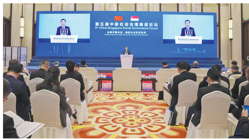
第五届中新社会治理高层论坛20日在浙江杭州举行。中共中央政治局委员、中央政法委书记陈文清出席并致辞。

法合治，善于以法之道、以礼之道等调解社区纠纷。中新关系源远流长，社会治理愿景相同、理念相近，希望双方进一步加强交流合作，汲取借鉴各自在社会治理方面的经验做法，更好造福两国人民。