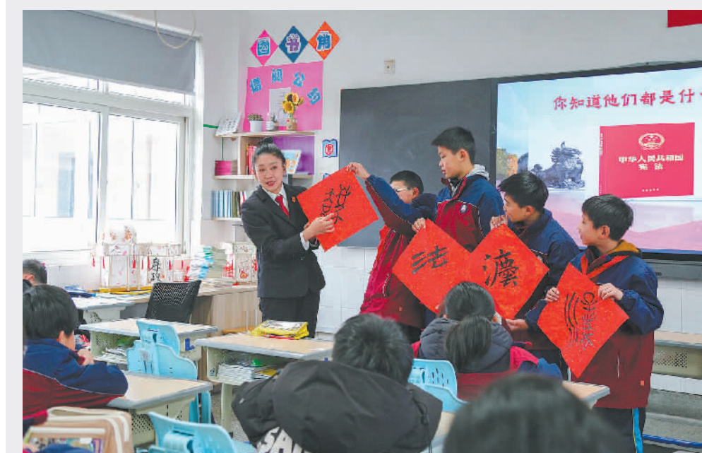
▲2月14日，浙江省湖州市南浔区人民法院法官走进菱湖实验小学，开展形式多样、内容丰富的“开学第一课”法治教育活动，以法治之力不断提升青少年法治意识和法治素养。图为法官向学生们介绍“法”字的演变历程。