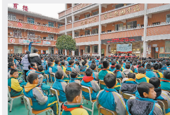
▲2月13日，春季开学第一天，广东省连南瑶族自治县人民法院组织干警走进三江镇潭溪小学，为学生们送上内容丰富的“法治礼包”。法治课上，法院干警结合典型案例讲解法律法规，引导同学们树立正确法治观念，远离违法犯罪。图为法治课现场。