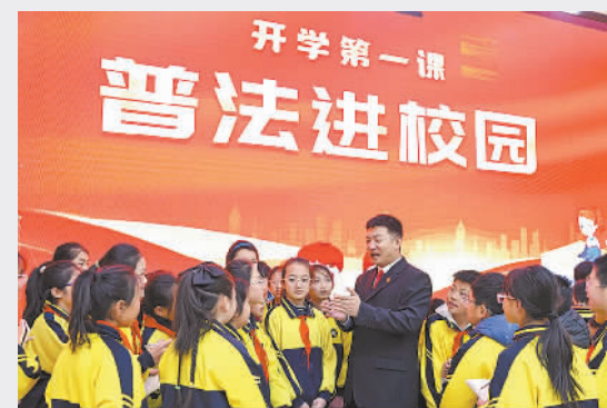
▲2月14日，山东省枣庄市市中区人民法院组织法官走进校园，为学生上好“普法第一课”，增强学生们的法治观念和自我保护意识。图为法官在东湖小学与学生们进行法律知识互动交流。