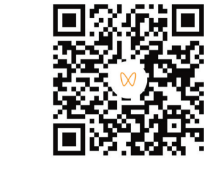
观看专访视频 扫描二维码

角法院在知产保护、金融审判等方面的法律适用和裁判尺度统一。二是加强执行联动。设立专职团队对接G60执行协作事项，探索打造“云端执行”体系，针对科创企业资产特性，推行“活封活扣”跨区域互认，避免多头查封影响企业生产。三是强化数字赋能。深化长三角司法数据共享，推动立案、庭审、保全、执行等全流程跨域通办。同时，完善常态化会商、人才互鉴机制，推动司法协作从“点对点”向“一体化”升级，以高质量司法护航长三角高质量一体化发展。